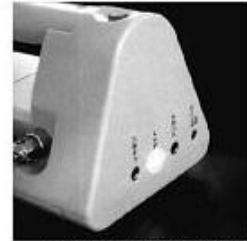
▲高輝度白色LEDを採用