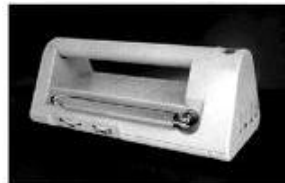
▲持ち運びに便利な大型把手付 及び市内事業所】