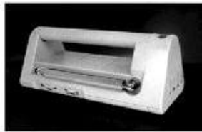
▲持ち運びに便利な大型把手付 及び市内事業所】