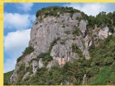
車 50分 P有 歩 10分 距 20km

表丹倉と裏丹倉を含む山塊の総称で、高さ300mもの火成岩で形成された巨岩は、岩に含まれる鉄分が酸化し、所々に赤みを帯びて見えます。また、古来より修験者たちの聖地であったと言われていました。