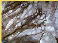
車 40分 P有 距 19km

清流・尾川川の川床には、六角形の柱を縦に積み重ねたような柱状節理といわれる自然の割れ目が発達しています。柱状節理の風化現象でできた独特の模様は上から見ると蝶が羽を広げているように見えます。