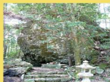
車 40分 距 17km

高さ10mはあるかどうかという球状の岩が鎮座し、岩と樹木が同化しているのが分かります。社殿はなく、祭神も不詳。原始の山岳信仰を受け継ぐ修験者たちの修行の場であり、巨岩に神を感じる自然信仰の原点とも言われる場所です。