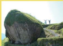
車 37分 P有 距 21km

人が作り上げた棚田が自然と調和した類い稀なる風景を造り出し、美しさと感動を与えてくれます。また、中腹にある大石は、幾千年にも過ぎ行く時を見守り続けてきた千枚田のシンボリックな存在です。