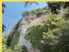
車 3分 P有 距 1.6km

高さ10mはあるかどうかという球状の岩が鎮座し、岩と樹木が同化しているのが分かります。社殿はなく、祭神も不詳。原始の山岳信仰を受け継ぐ修験者たちの修行の場であり、巨岩に神を感じる自然信仰の原点とも言われる場所です。