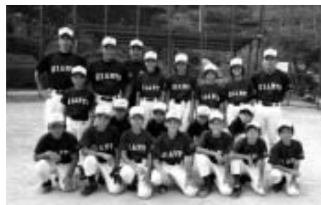
▲われら木本リトルジャイアンツ！