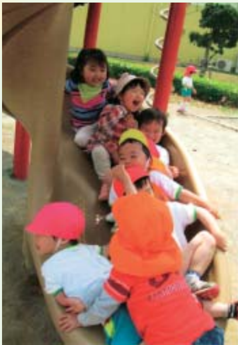
くるくるすべり台