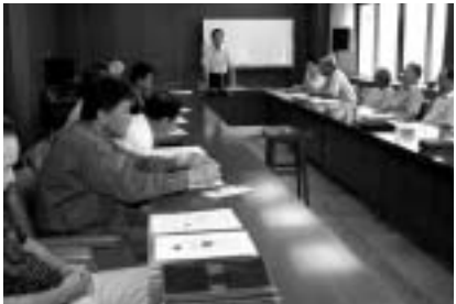
熊野市地域まちづくり協議会連絡会議

「市民が主役、地域が主体のまちづくり」を実践するため、平成16年度（紀和町の3地区は平成17年度以降）から市内18地区で地域住民による地域まちづくり協議会が設置されています。