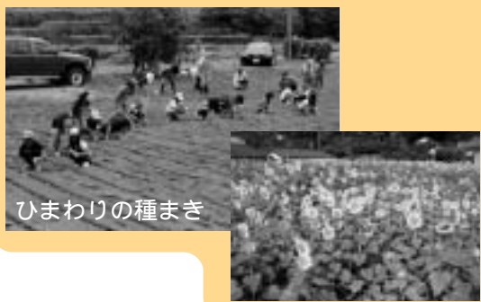
ひまわりの種まき