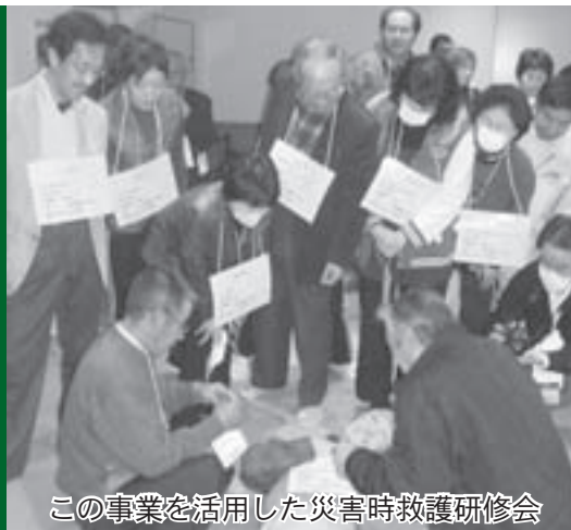
この事業を活用した災害時救護研修会

皆さんはどのような活動がしたいですか？個人や友達同士、 また、今集まっているグループなどで何かやろうと思いませんか？