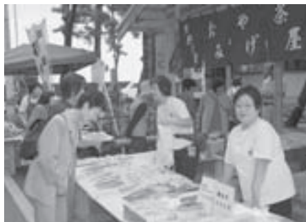
茶屋「花の岩屋」の設置