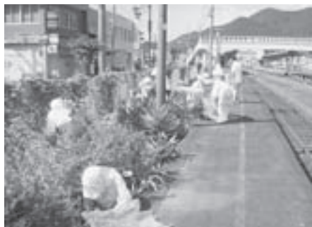
公共施設への花壇の設置