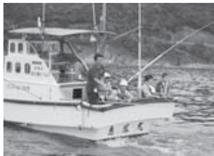
体験漁業の資格取得