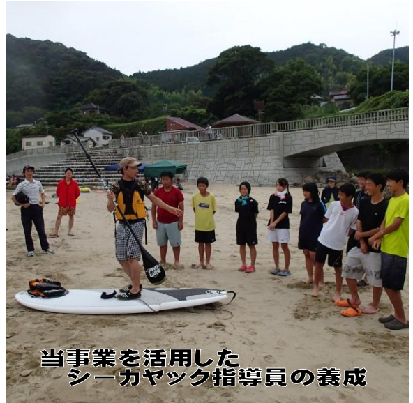
当事業を活用したシーカヤック指導員の養成

みなさんはどのような活動がしたいですか？ 個人や友達同士、または今集まっているグループなどで何かやろうと思いませんか？