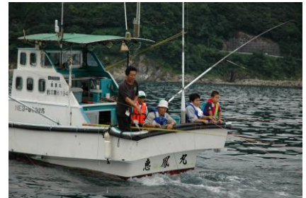
体験漁業の資格取得