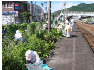
公共施設への花壇の設置