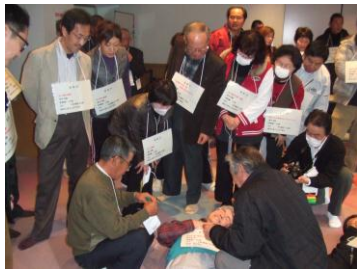
災害研修会の開催