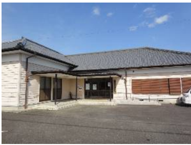
【金山多目的集会所】