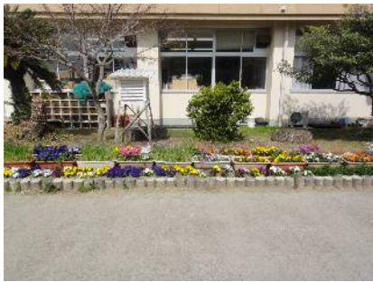
【有馬小学校の花づくり】