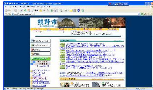
【熊野市ホームページ】