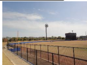
【山崎運動公園くまのスタジアム】