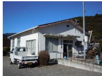
【長井生活改善センター】