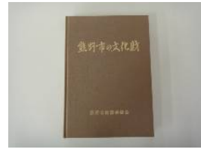
【図書「熊野市の文化財」】