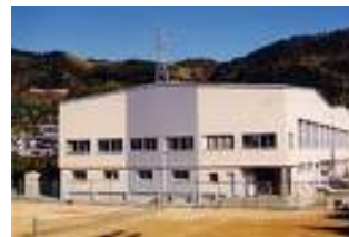
【市総合グラウンド】