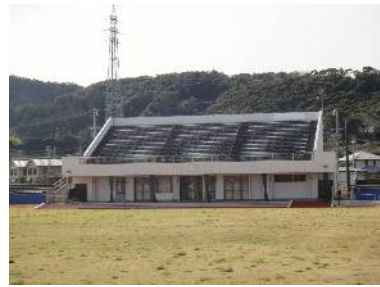
【山崎運動公園多目的グラウンド管理施設】