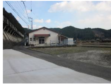
【神山生活改善センター】