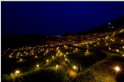
【丸山千枚田の虫おくり】