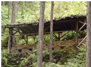
【水車谷鉦山跡竈跡】