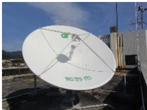
【県衛星系防災行政無線】