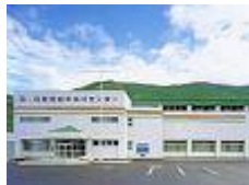
【紀和B&G海洋センター】

【財源内訳】 B&G財団補助金 2,010万円 市の借入額 1,430万円 市の負担額 81万円