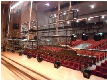
【市民会館舞台照明】